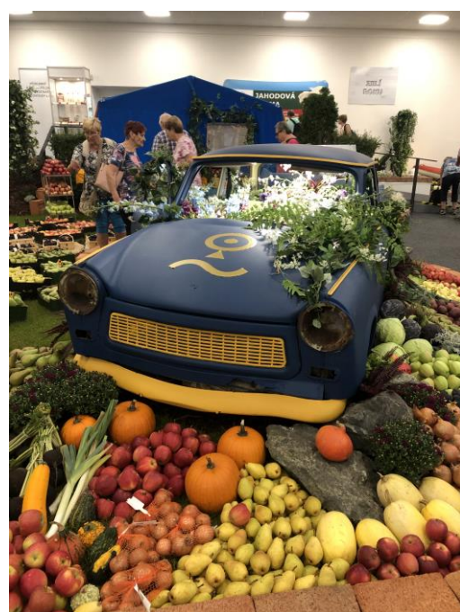
Foto: prezentace činnosti Místních akčních skupin Ústeckého kraje ve společném stánku SZIF na celostátní výstavě Zahrada Čech v Litoměřicích v září 2023