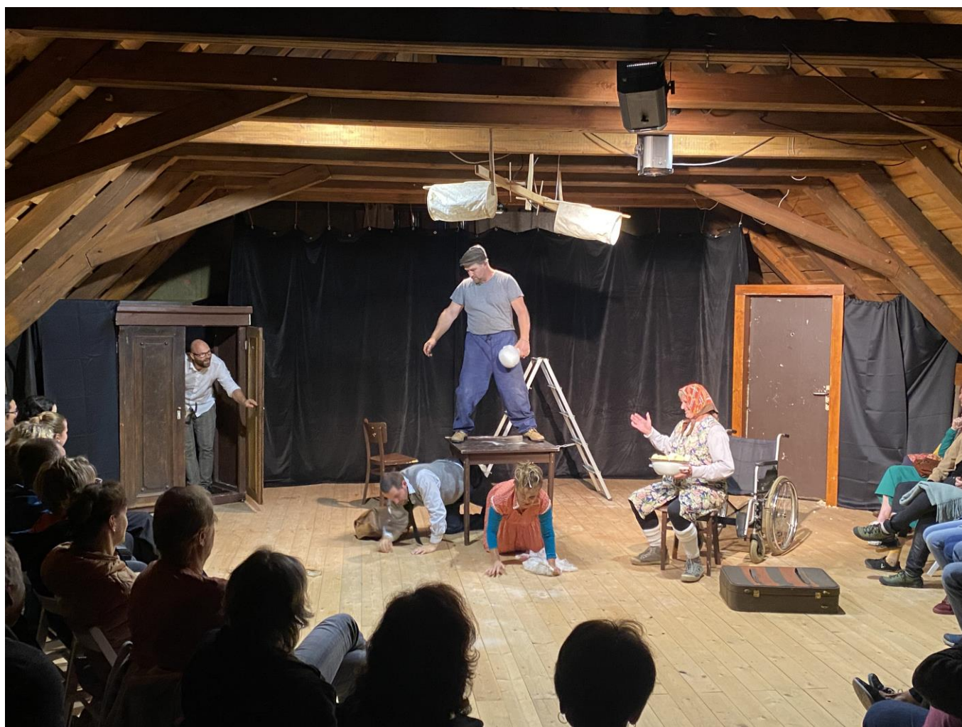
Foto: představení Podivné odpoledne Dr. Zvonka Burkeho z cyklu Divadelní léto ve stodole; finančně podpořeno z programu Podpora komunitního života na venkově 2023