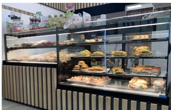
Foto: vybavení prodejny lahůdek v Rumburku (Program rozvoje venkova)